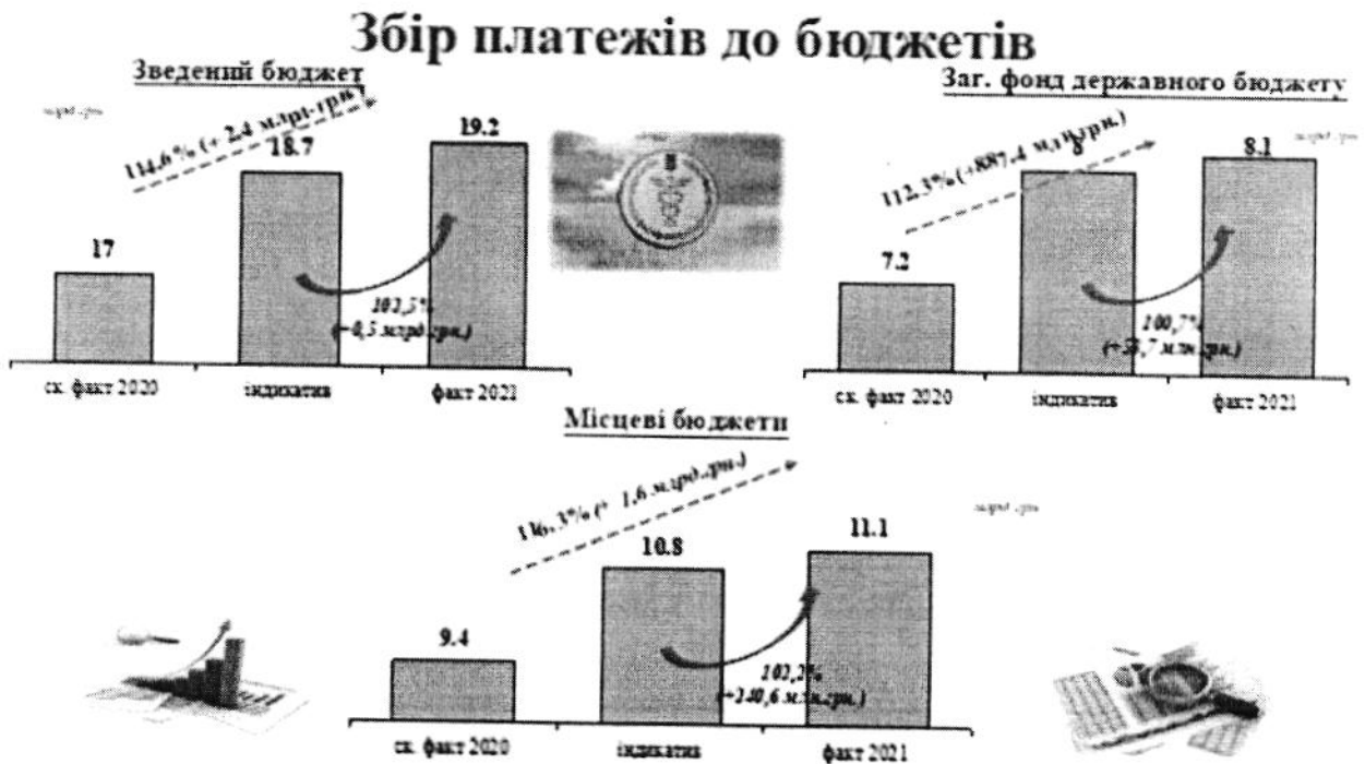
Графік 1. Виконання індикативних показників доходів до загального фонду державного бюджету за 2021 рік, млн грн

До державного бюджету у 2021 році зібрано 8088,2 млн грн, що на 887,4 млн грн (12,3 відс.) більше ніж у 2020 році. Виконання індикативних показників доходів забезпечено на 100,7 відс. (+53,7 млн гривень).