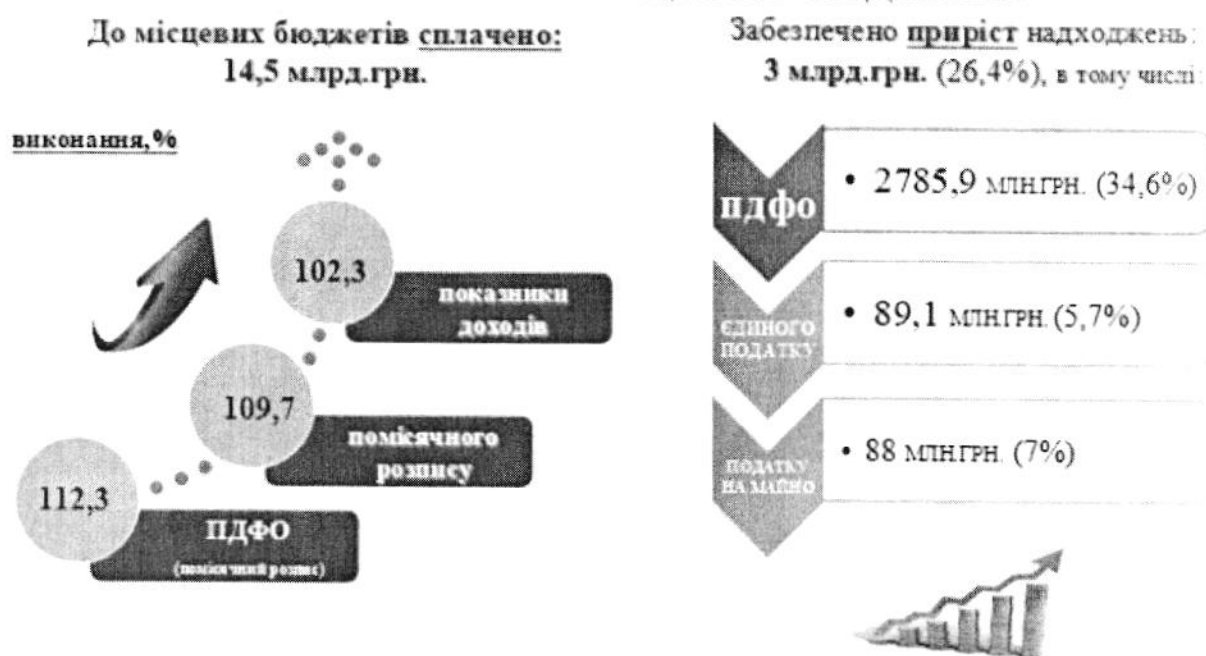
Графік 2. Надходження платежів до місцевих бюджетів, млн гривень

Надходження податку на доходи фізичних осіб (далі – ПДФО) до місцевих бюджетів у 2022 році склали 10842,3 млн гривень. Приріст надходжень до 2021 року становить 34,6 відс. (+2785,9 млн грн), виконання помісячного бюджетного розпису органів місцевого самоврядування забезпечено на 112,3 відс. (+1184 млн гривень).