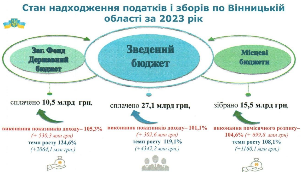
Графік 1. Виконання показників доходів та приріст надходжень за 2023 рік

До загального фонду державного бюджету у 2023 році зібрано 10465,6 млн грн, що на 2064,1 млн грн (24,6 відс.) більше ніж у 2022 році. Виконання показників доходів забезпечено на 105,3 відс. (+530,3 млн гривень).