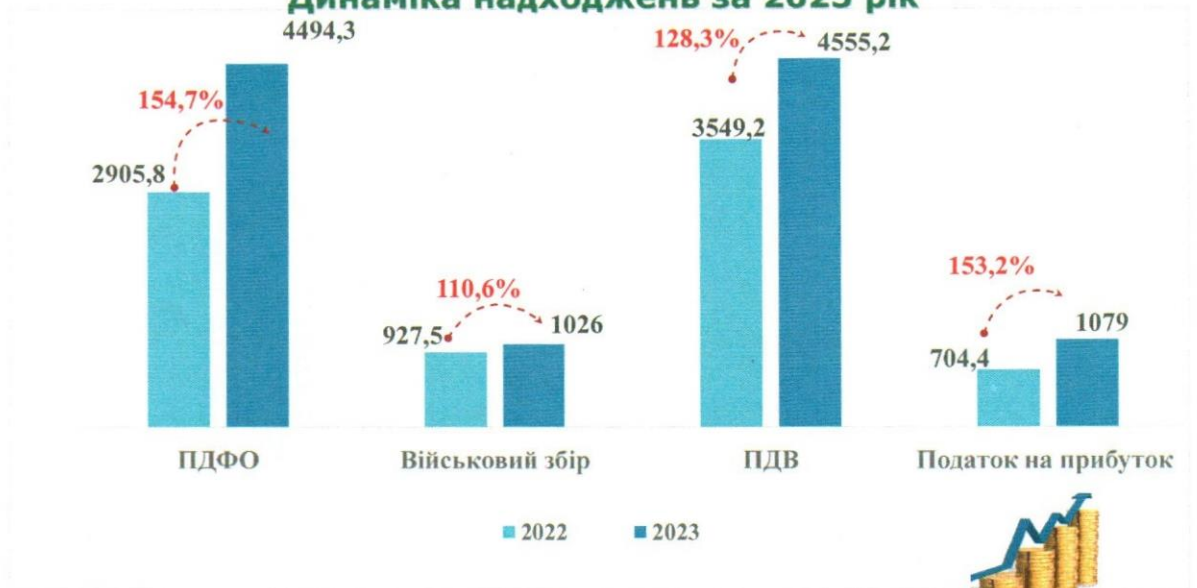
Графік 2. Надходження платежів до Державного бюджету (млн грн)

До місцевих бюджетів в 2023 році надійшло 15488,6 млн гривень. Приріст до 2022 року склав 1160,1 млн грн або 8,1 відсотка.