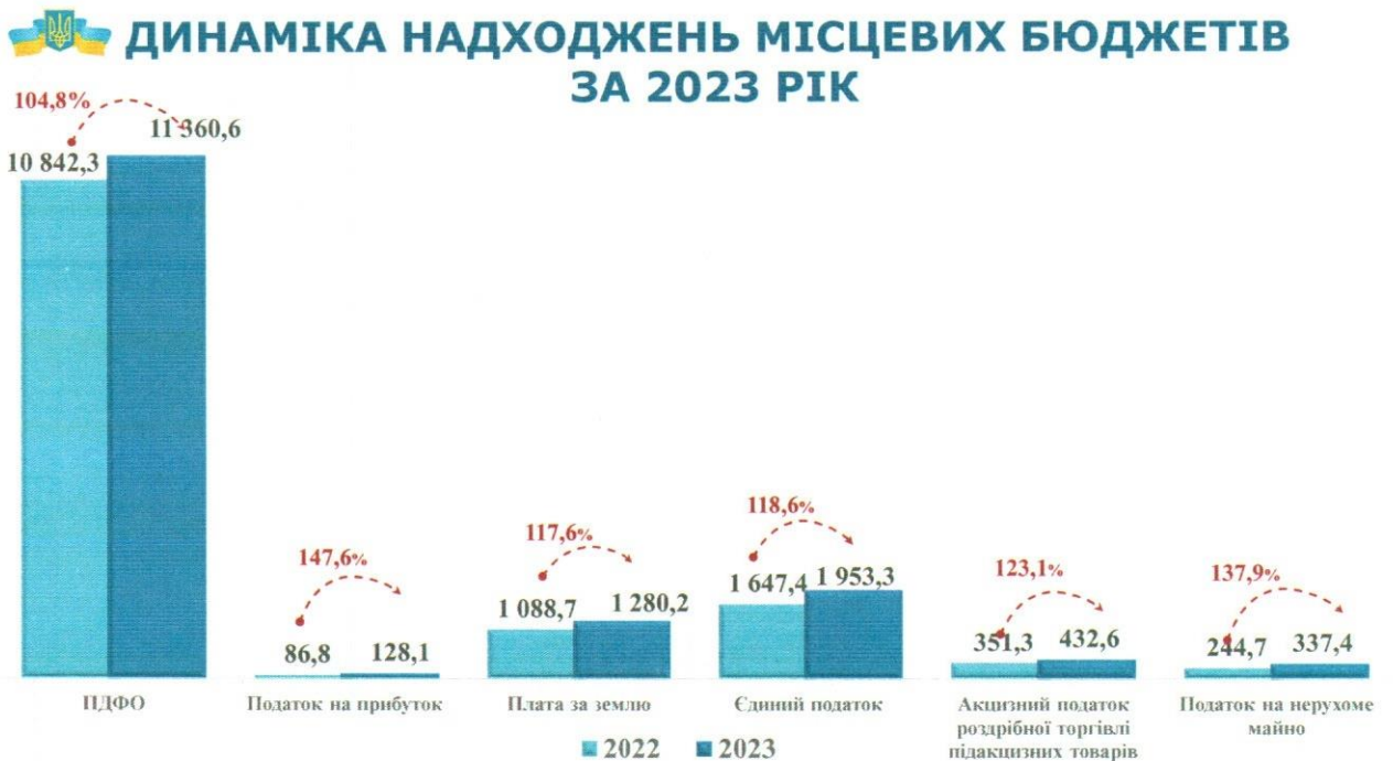
Графік 3. Надходження платежів до місцевих бюджетів (млн грн)

Надходження податку на доходи фізичних осіб (далі – ПДФО) до місцевих бюджетів у 2023 році склали 11360,6 млн гривень. Приріст надходжень до 2022 року становив 4,8 відс. (+518,3 млн грн), виконання помісячного бюджетного розпису органів місцевого самоврядування забезпечено на 103,1 відс. (+344,9 млн гривень).